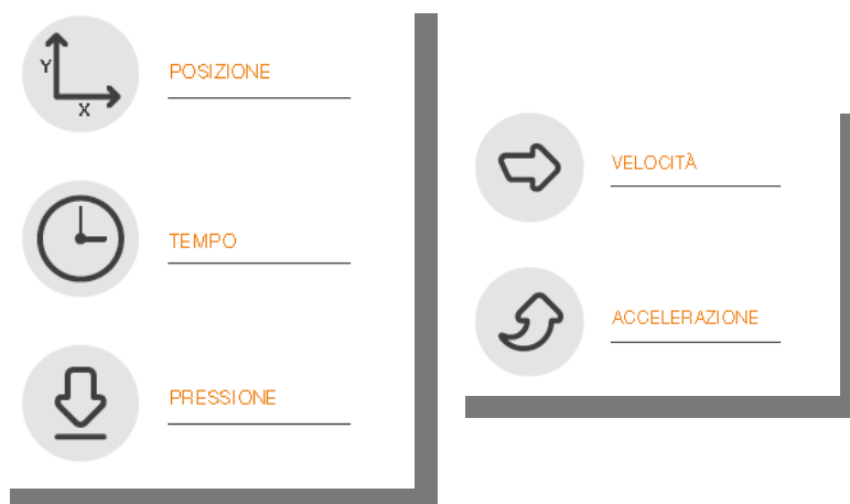
Fig.1 - Schema

Gli elementi disponibili nell'apposizione della sottoscrizione da parte del FIRMATARIO , sono i dati biometrici e comportamentali, quali: Posizione della penna, Pressione, Tratto in aria (percorso che fa la penna quando non tocca nel device, fino a 1cm ), e Tempo. E' possibile elaborare velocità e accelerazione ai fini di analisi forensi.